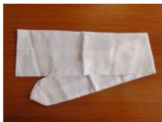
16 改良まくら用ガーゼ ¥750