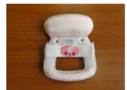
15 改良まくら (8) ¥2,650