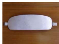
14 帯板 (ピンク) ¥720