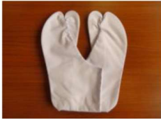
1 テトロンブロード足袋21.5~24.5 ¥1,200 " (4枚コハゼ) 25~27.5 ¥1,300