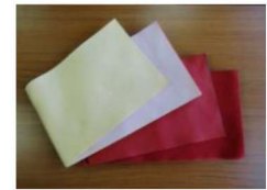
30 リバーシブルゆかた帯(赤・黄・紫系) ¥1,400