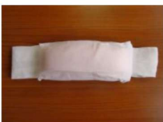
13 お太鼓枕 (ガーゼ付) ¥1,600