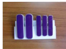
17 紫色クリップセット(大2本・中3本) ¥4,000