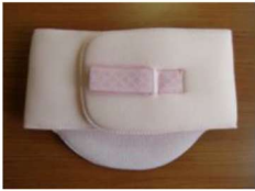
22 腰パット (ピンク)