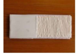
6 伊達締め (ピンク) ¥1,250