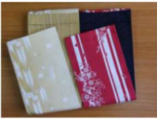
28 半巾帯 (赤・紫・金茶系)