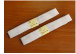
9 モスリン腰紐・長尺2本 ¥780