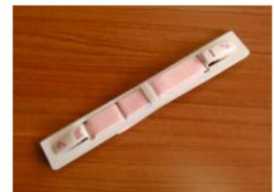
12 コーリンベルト (ピンク) ¥1,400