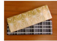
27 細帯 (黒・ベージュ・金茶系) ¥4,200