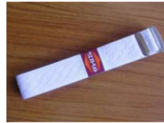
8 腰紐 (ウエストベルト) (ピンク) ¥620