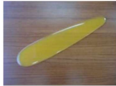
23 着付け ヘラ