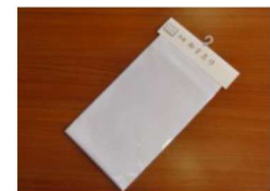
18 半衿 (ポリエステル) ¥410