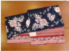
25 仕立上り袷着物 (黒・ピンク・ベージュ・茶) ¥5,800