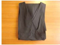
20 黒 ユニフォーム