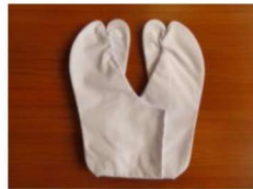
2 ストレッチ足袋5枚コハゼS・M・L ¥1,240