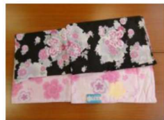
29 仕立上がりゆかた(黒・ピンク・白系)