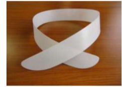
24 えり芯 (2枚組)