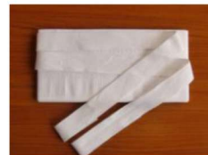
11 伊達巻 白(2m30cmポリエステル) ¥1,900