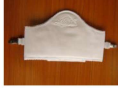
5 きものファンデーション(フリーサイズ) ¥3,900