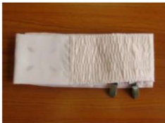
7 新伊達締め (サッシュ) 金具付き ¥2,100