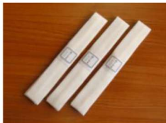
10 モスリン腰紐・3本組 ¥780