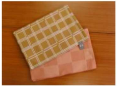
26 仕立上り八寸帯 (黒・ローズ・金茶系) ¥5,800