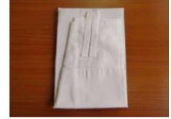
3 裾よけ M・L ¥3,800