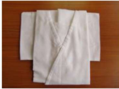
4 肌襦袢 M・L ¥1,800